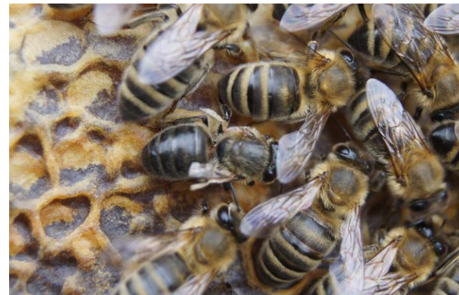
Durch Varroabefall und das Deformed-Wing-Virus stark geschädigte Arbeiterin.