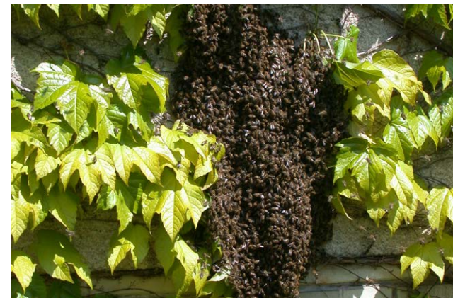
„Geteiltes Leid ist halbes Leid“ – beim Schwärmen teilen sich nicht nur Brut und Bienen, sondern auch die Milbenpopulation.

Durch die frühzeitige Befallssenkung im Sommer können die Winterbienen gesund aufwachsen und Winterverluste vermieden werden. Sofern die biotechnischen Maßnahmen effizient durchgeführt wurden und der externe Milbendruck gering ist, kann in der Regel ganz auf den Einsatz von Medikamenten im Herbst und Winter verzichtet werden. Hierzu muss man sich allerdings durch Befallskontrollen zwischen August und Oktober vergewissern, dass der Befall unterhalb bestimmter Grenzwerte liegt (s. Tab. S. 6).