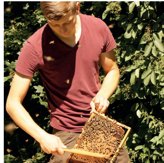
Abfegen der Bienen.

In der nebenstehenden Abbildung wird der Anstieg der Milbenzahl in einem nicht geschwärmten, unbehandelten Volk gut ersichtlich. Die steigende Zahl der Milben bei gleichzeitig abnehmender Brutaktivität der Bienen sorgt dafür, dass die verbleibende Brut im Spätsommer immer stärker parasitiert wird. Die typische zweigipflige Brutkurve der behandelten Völker verdeutlicht hingegen die Auswirkungen einer Brutpause, wie sie z. B. im Zuge des Schwärmens auftritt. Die Bienen gehen nach der Unterbrechung rasch wieder in Brut, während die Milbenpopulation langfristig geschädigt ist. Im Vergleich zu den unbehandelten, ungeschwärmten Völkern ist die Milbenanzahl deutlich reduziert.