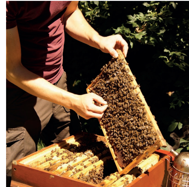
Fangen der Königin.