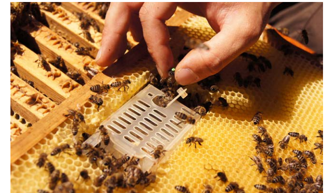
Einsperren der Königin durch eine Zusatzöffnung.