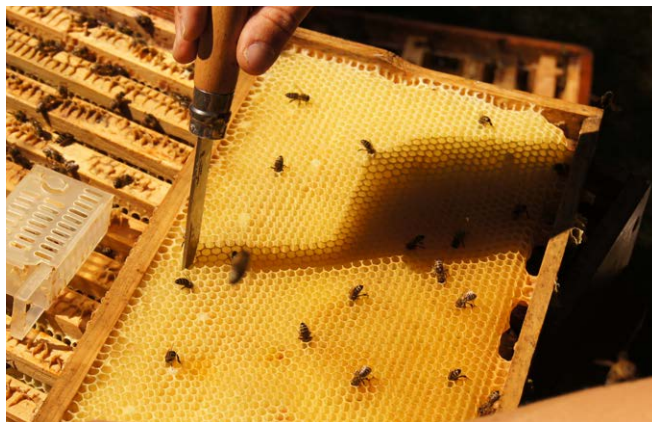
Der Durchlaufkäfig wird vor Ort eingepasst. Solche „Käfigwaben“ können auch gut vorbereitet und mehrfach verwendet werden.

Damit die Königin wieder gut angenommen wird, müssen große mit Absperrgittern versehene Durchlaufkäfige (z. B. sogenannte „Varroa-Kontroll-Kästchen“) verwendet werden, in denen die Königin in ständigem Kontakt mit den Bienen bleibt.