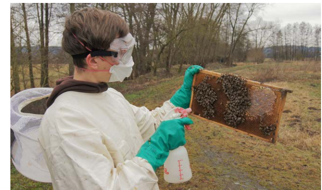
Die Behandlung kann durch Einsprühen mit Oxalsäure erfolgen.