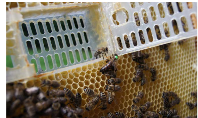
Zum Freilassen der Königin wird der Käfig geöffnet.