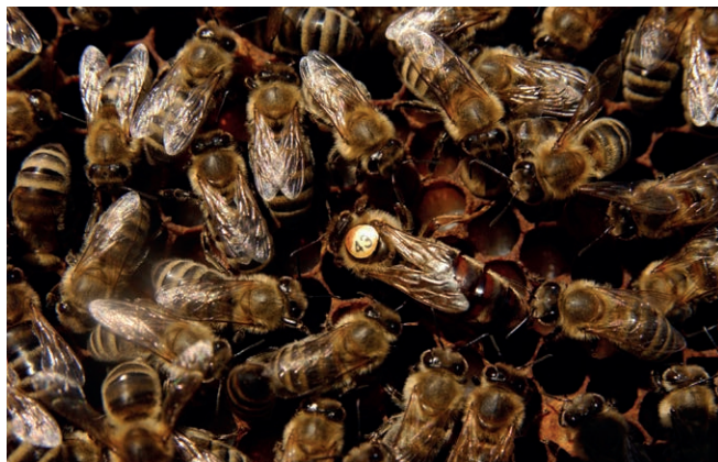
Sofort nach dem Freilassen wird die Königin von ihrem Hofstaat umringt.

Frühestens zwei bis drei Wochen vor Trachtende bis etwa Mitte August.