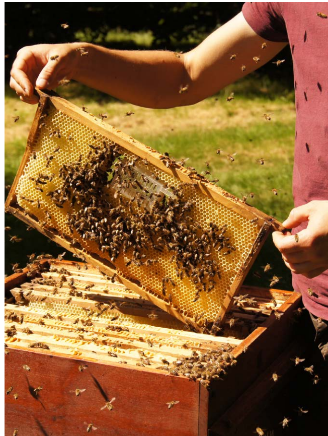
Die Wabe mit dem Käfig wird zentral in das Brutnest gehängt.

Vor der Säurebehandlung muss der Honig jedoch abgeerntet werden.